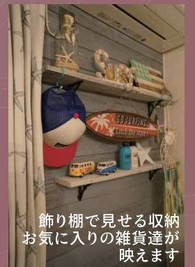
飾り棚で見せる収納 お気に入りの雑貨達が 映えます