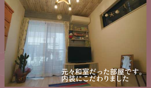
元々和室だった部屋です。 内装にこだわりました

雑貨が好きなので家族のために 昔ながらの和風なおうちを ヴィンテージスタイルに フルリノベーション！