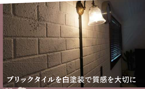
ブリックタイルを白塗装で質感を大切に