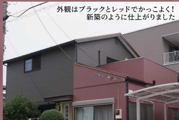
外観はブラックとレッドでかっこよく！ 新築のように仕上がりました