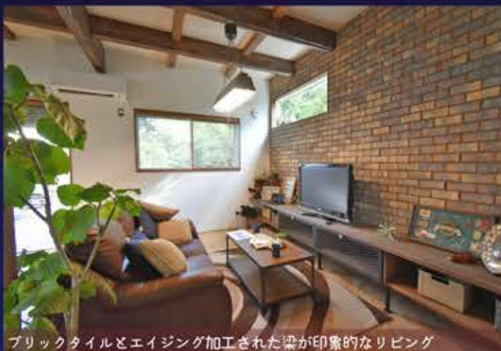
ブリックタイルとエイジング加工された梁が印象的なリビング