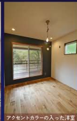
アクセントカラーの入った洋室