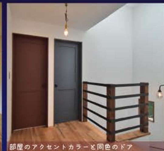
部屋のアクセントカラーと同色のドア

建築士事務所登録 埼玉県知事(5)第6681号 建設業許可 埼玉県知事(般-29)第5481号 宅地建物取引業者登録 埼玉県知事(2)第22363号 1級建築士事務所 総合建設業 宅地建物取引業