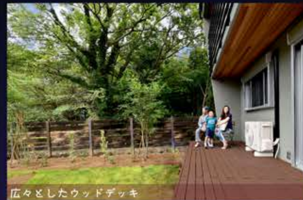
広々としたウッドデッキ