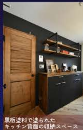
黒板塗料で塗られたキッチン背面の収納スペース