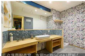
広々洗面脱衣室。水廻りは遊び心のある壁紙。