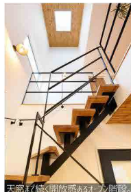
天窓よく続く開放感あるオープン階段。