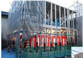
0棟部上棟いたしました♪

お電話(048-281-0625)もしくは ホームページよりお問い合わせ お待ちしております。