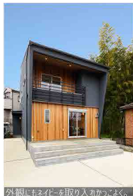
外観にもネイビーを取り入れています。