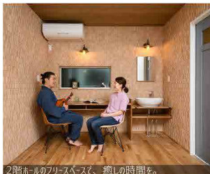
2階ホールのフリースペース、癒しの時間を。