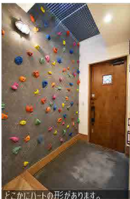
どこかにハートの形があります。